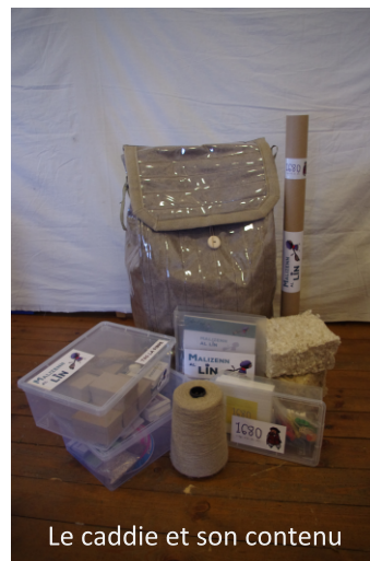
Le caddie et son contenu

4 exemplaires sont répartis sur les départements bretons. Ce dispositif est disponible en prêt gratuitement pour tous ceux qui souhaitent mener des projets en lien avec le thème du lin (écoles, collèges, centres de loisirs...).